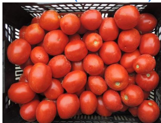
ISI-22700 (ISI Sementi)