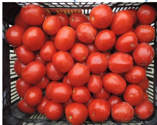
Red Sky (Nunhems)