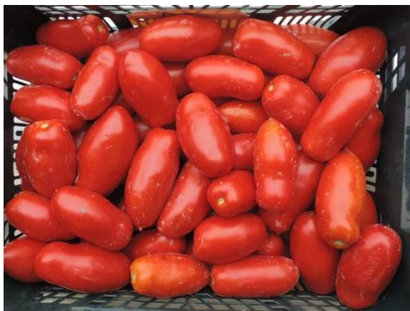
ISI 11577 (ISI Sementi)