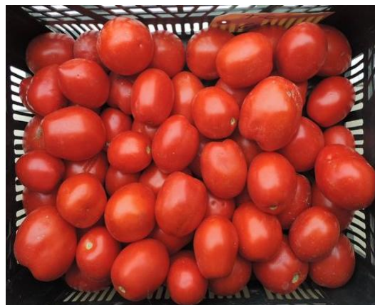
ISI 29739 (ISI Sementi)