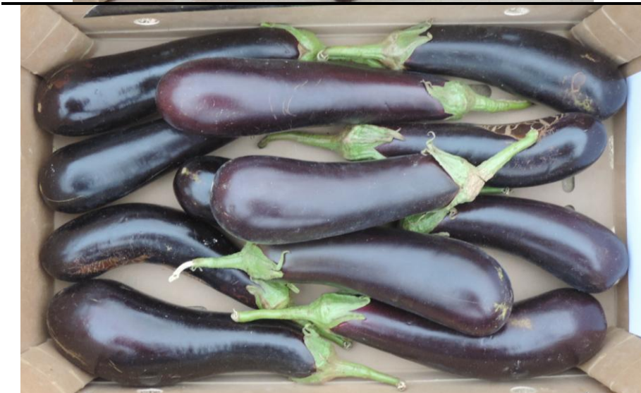
NITE LADY (JAD IBERICA)