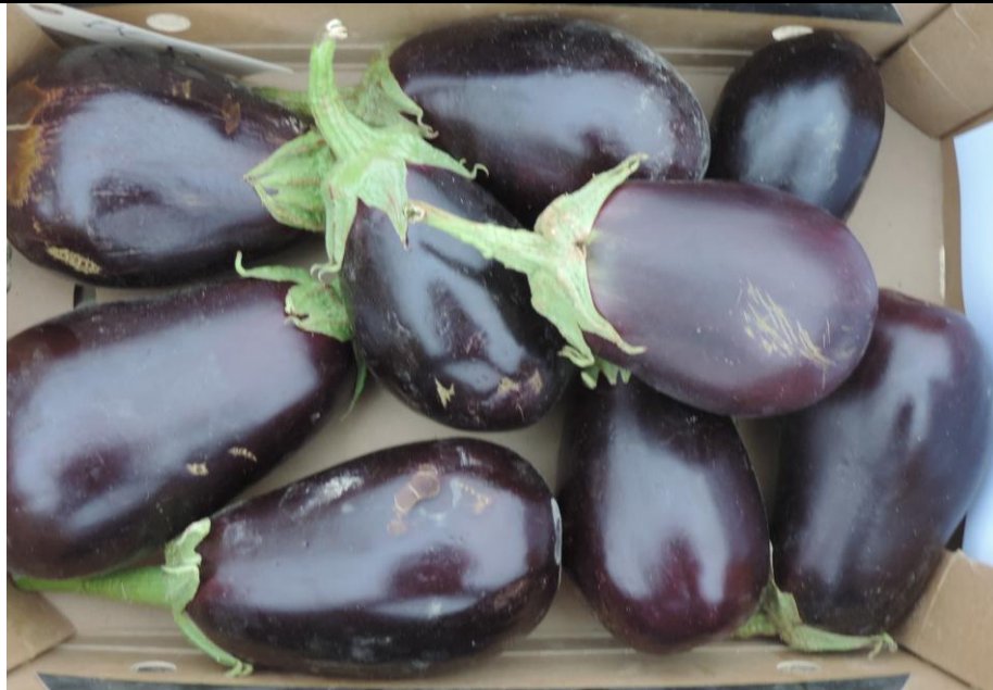
MATRONA (DIAMOND SEEDS)