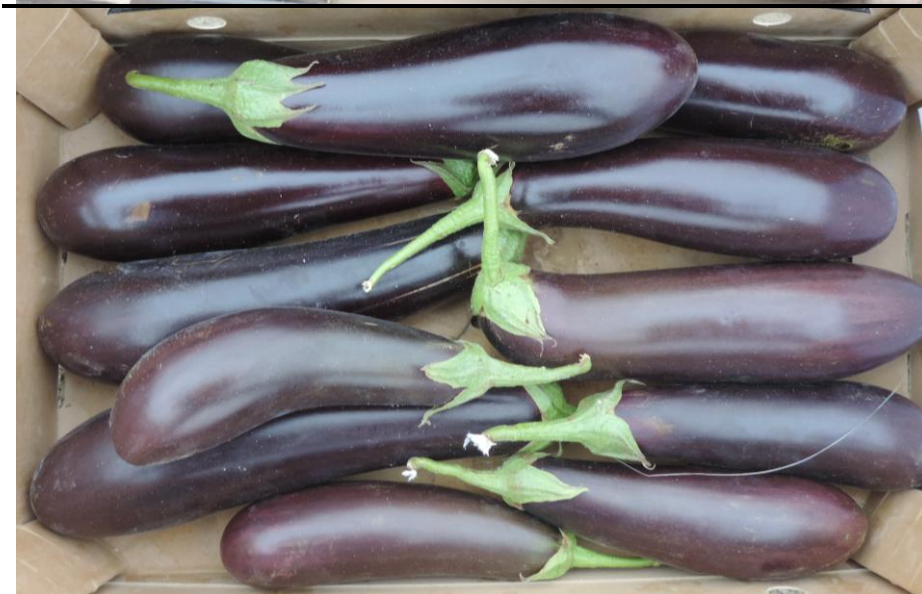
BE015 (MERIDIEM SEEDS)