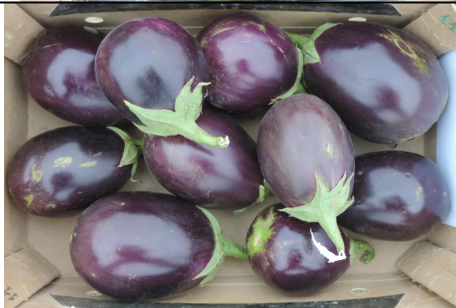
PERFECTION (JAD IBERICA)