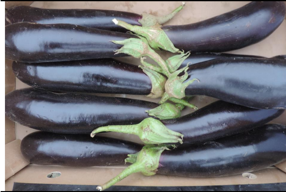
AR-04075 (RAMIRO ARNEADO)