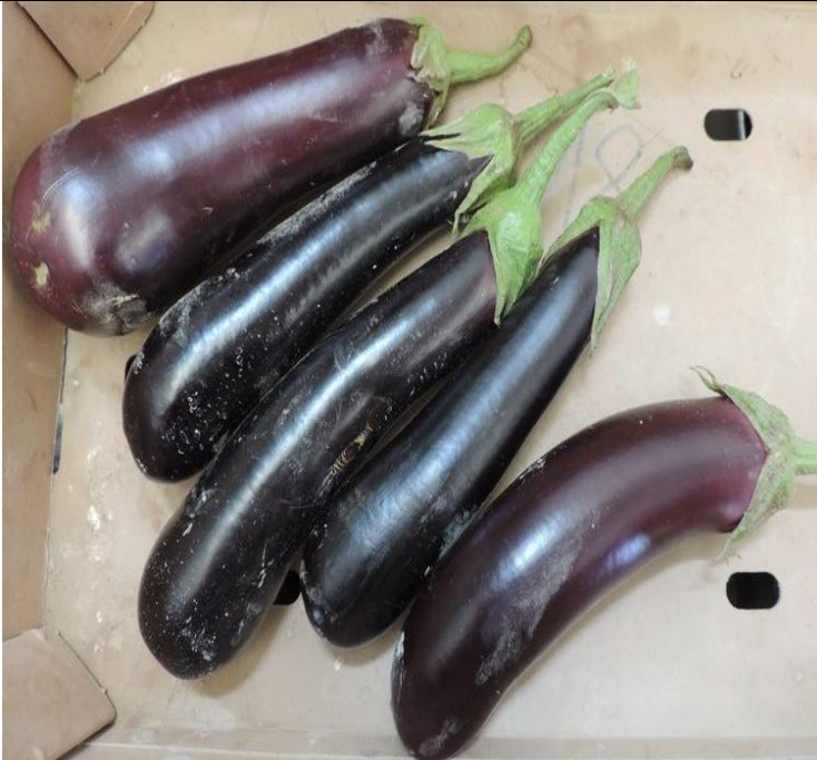
NILO (RIJK ZWAAN)