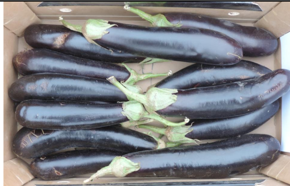
TERESA (DIAMOND SEEDS)