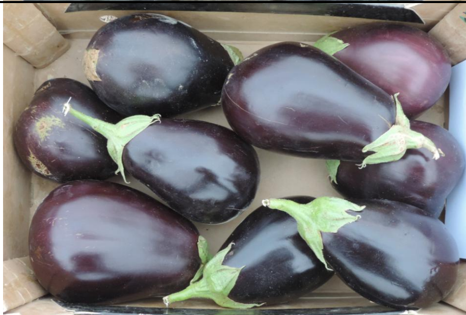
PARIS (RAMIRO ARNEDEO)