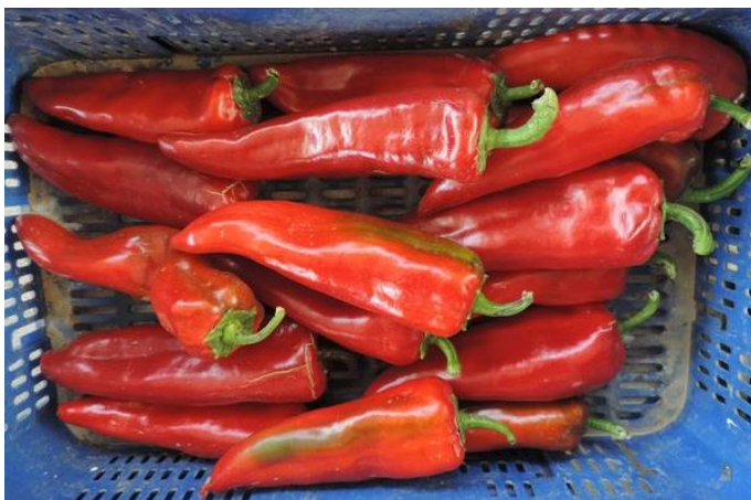
MARMARA (R. ARNEDO)