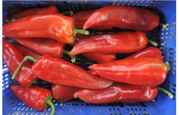
AR-37829 (R. ARNEDO)