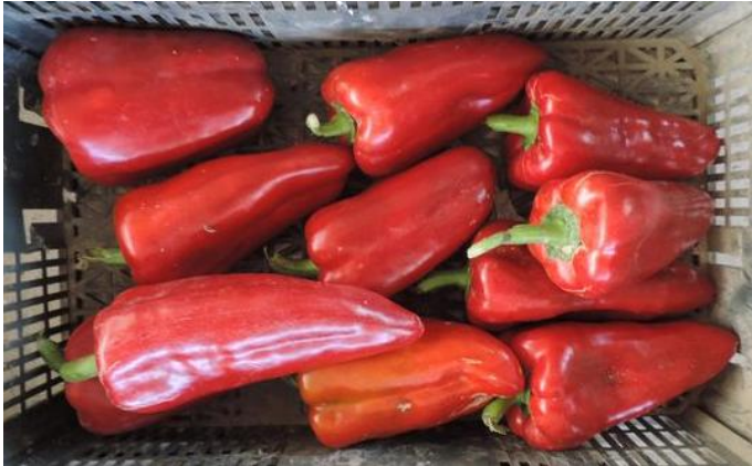
CORERA (R. ARNEDO)