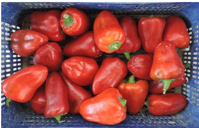
CIERZO (R. ARNEDO)