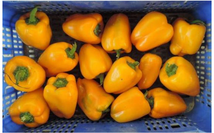
AR-37824 (R. ARNEDO)