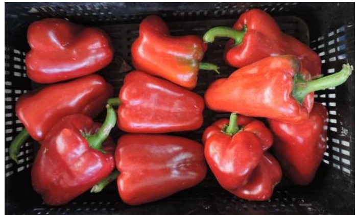
AR-37927 (R. ARNEDO)