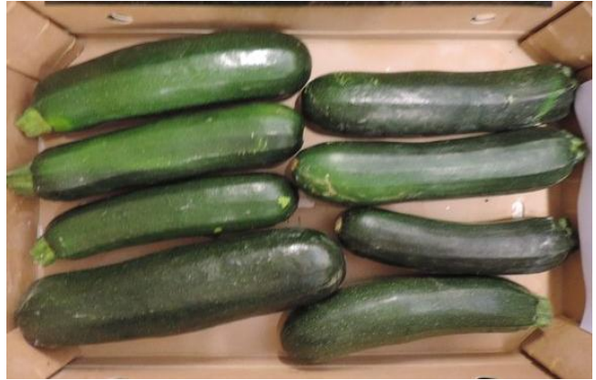
CALAZINA RZ (RIJK ZWAAN)