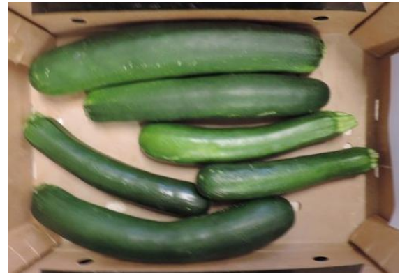
CV1414 (DIAMOND SEEDS)