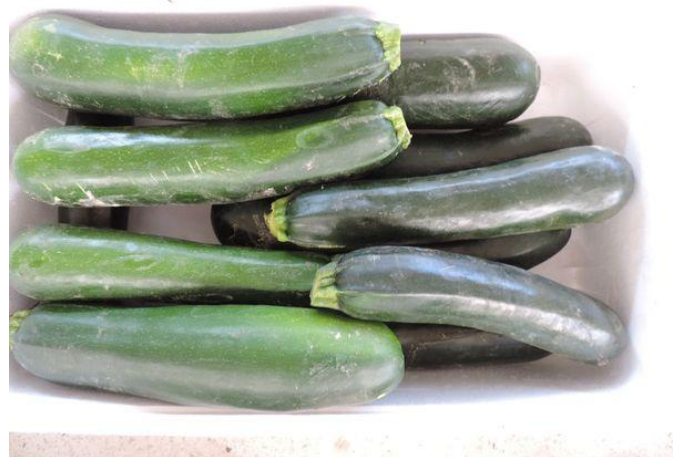
CALABONITA (RIJK ZWAAN)