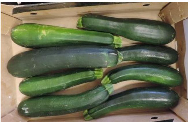
GALATEA (ENZA ZADEN)