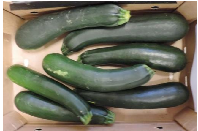
MS17-SQ058 (MERIDIEM SEEDS)