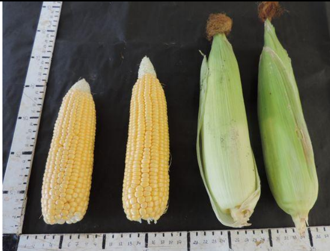
OVERLAND (GSS3287) (SYNGENTA)