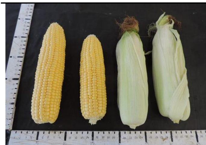
OVERTURE (STRUBE GMBH & CO. KG)