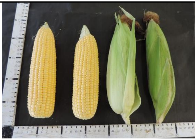
ZHY14940Y (STRUBE GMBH & CO. KG)