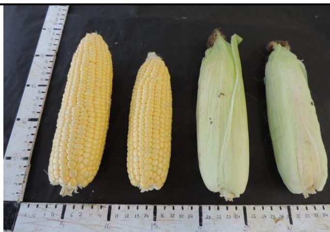
ZHY27860P (STRUBE GMBH & CO. KG)