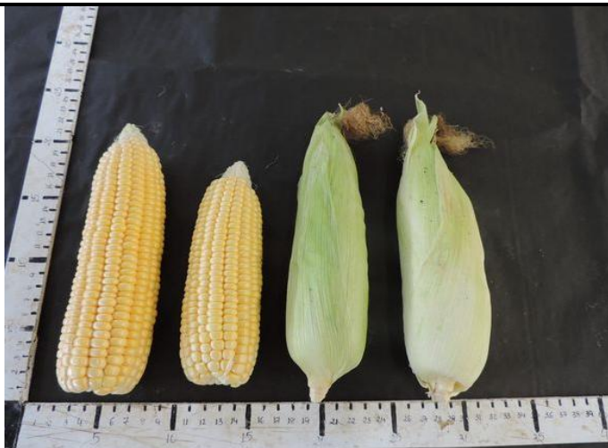
ZS-232 Y (ABBOTT & COBB)