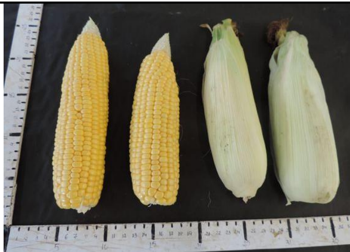
ZHY32780Y (STRUBE GMBH & CO. KG)