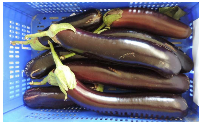
TERESA (DIAMOND SEEDS)