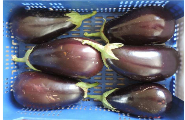
17OVB218 (RIJK ZWAAN)