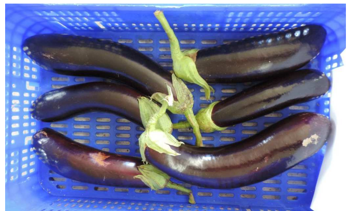
AR-04075 (RAMIRO ARNE DO)