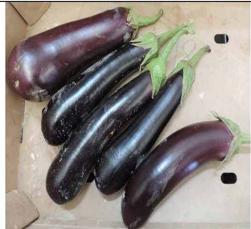
NILO (RIJK ZWAAN)