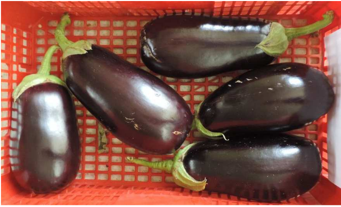
SAMBA (DIAMOND SEEDS)