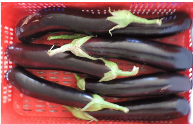
GRETA (RIJK ZWAAN)