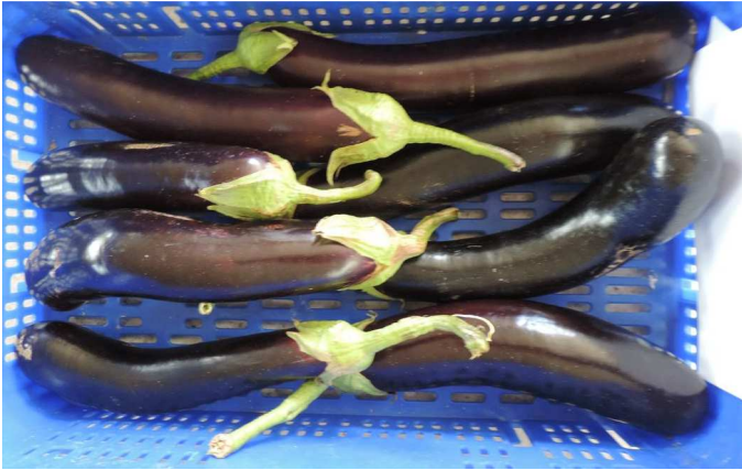
BL-1401 (DIAMOND SEEDS)