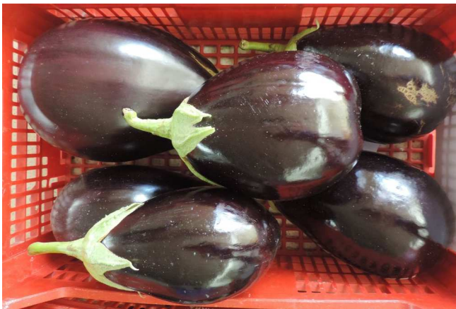
PARIS (RAMIRO ARNEDO)