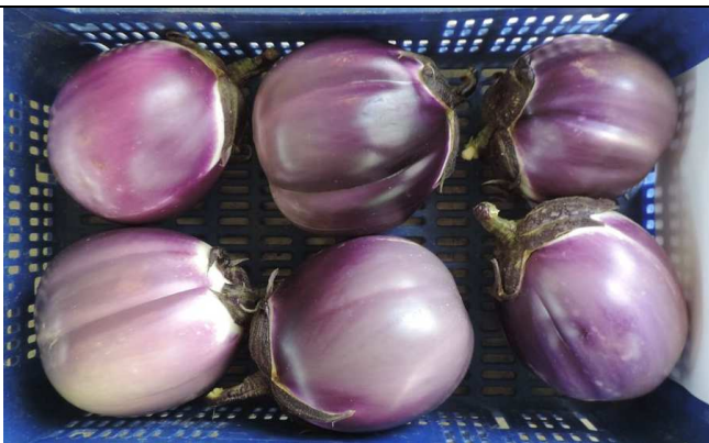
BRISKA (JAD IBÉRICA)