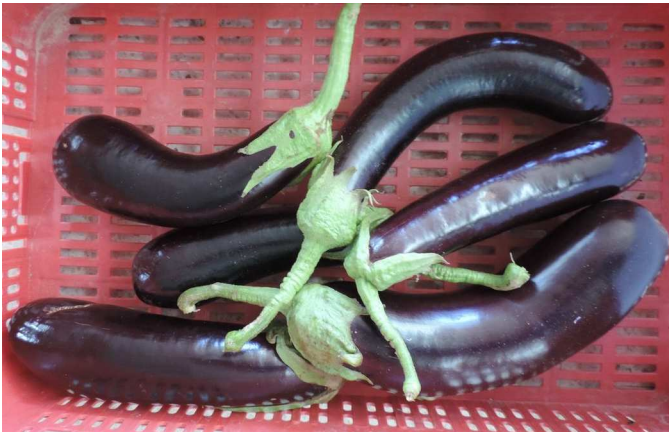
MILED A (SYNGENTA)