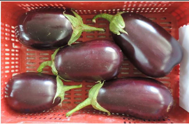
BLACK BELL (SEMINIS)