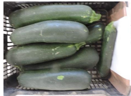
EL ZAR (DIAMOND SEEDS)