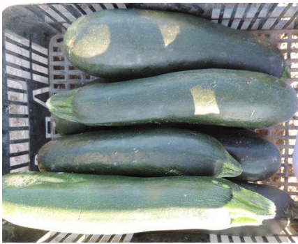
NERITA (MERIDIEM SEEDS)