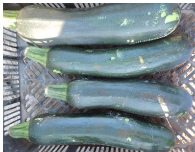
CALABONITA (RIJK ZWAAN)